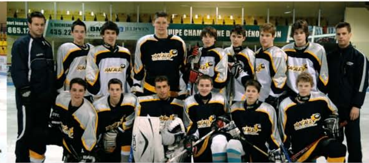
Les Rafales | Juvénile